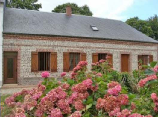
Gîte de la Condamine